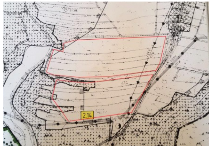
Bild Nr. 2 Plangebiet Flächennutzungsplan

Im wirksamen Flächennutzungsplan der Gemeinde Solnhofen wird die betreffende Fläche als Fläche für die Landwirtschaft ausgewiesen. Im Rahmen des Verfahrens zur Aufstellung des Bebauungsplanes Nr. 13 „Solarpark Hochholz“ der Gemeinde Solnhofen erfolgt parallel die Aufstellung der 3. Änderung des v. g. Flächennutzungsplanes.